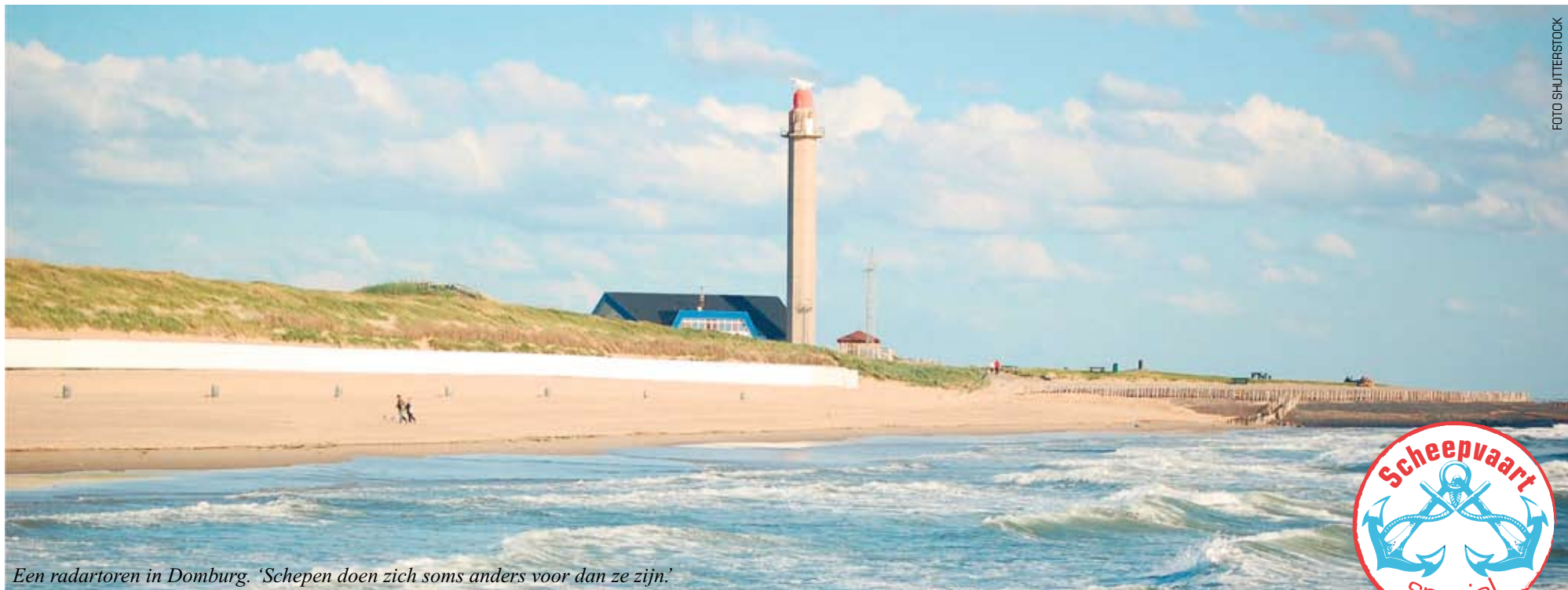
Een radartoren in Domburg. 'Schepen doen zich soms anders voor dan ze zijn.'