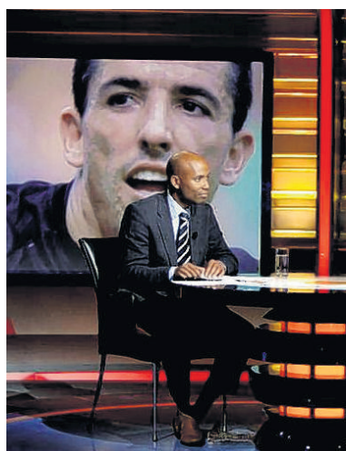
Voetbal kan lang niet iedereen meer bekoren.